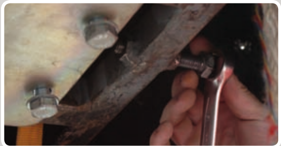
Spænd kontrabolten med en nøgle.