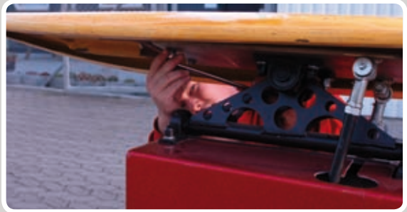
Sæt Surfboardet på motoren.