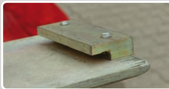
Løsn beslagene på motoren.