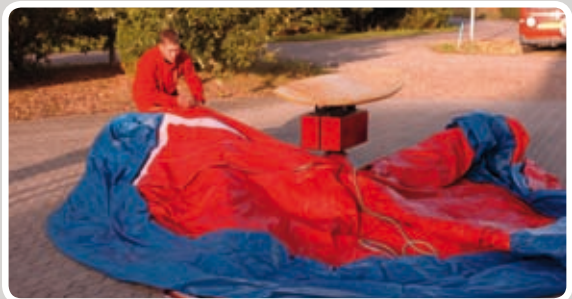
Fold madrassen ud omkring motoren.