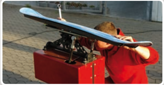
Sæt Snowboard'et på motoren.