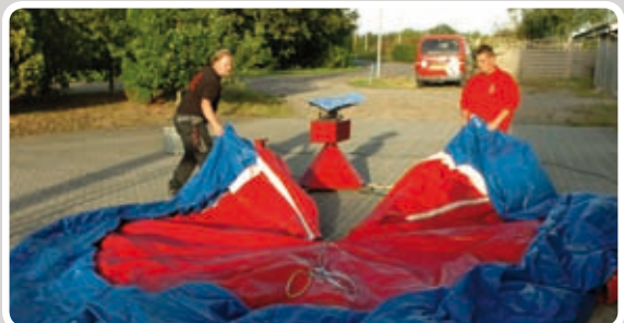
Fold madrassen ud omkring motoren.