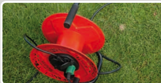
Rul forlængerkablet helt ud, og sæt det til strøm.