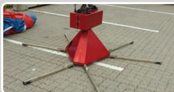
Motoren med alle seks stabiliseringsstænger.