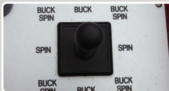
Stang til manuel styring af Snowboard'et.