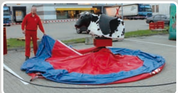
Fold madrassen ud omkring motoren.