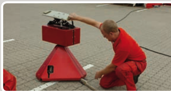
Stil motoren på et fladt underlag.