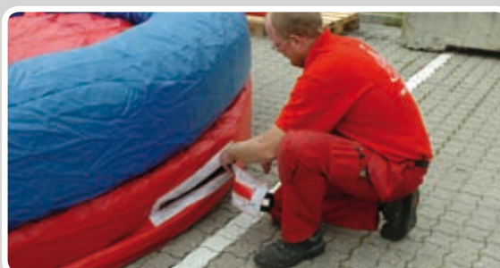
Lyn åbningerne og luk velcroen til.