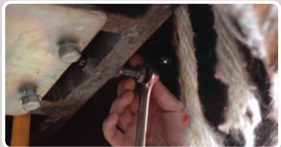
Spænd kontrabolten med en nøgle.