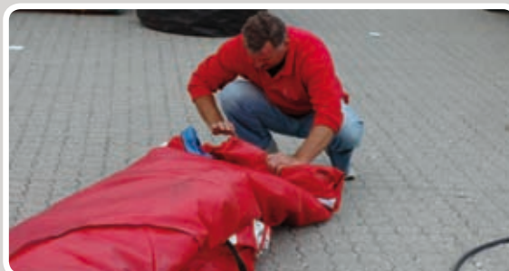
Rul madrassen sammen.