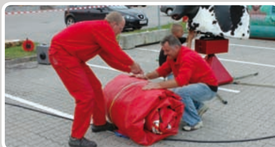
Bind den sammenrullede madras sammen med reb.