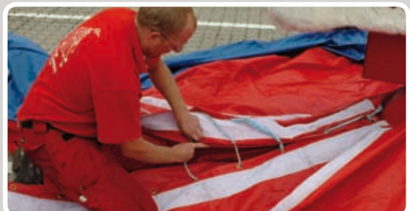
Sy madrassen sammen med reb og luk velcroen.