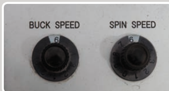
Manuel styring af hastighed.