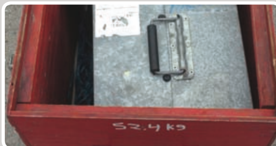
Læg pløkker, reb, kabelrulle og blæser i kassen.