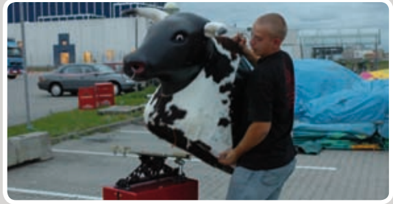
Sæt tyren på motoren.