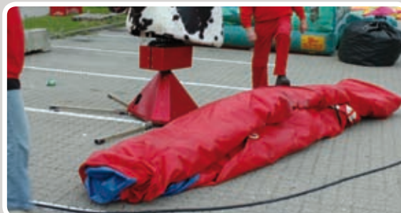
Fold derefter madrassen sammen på midten.