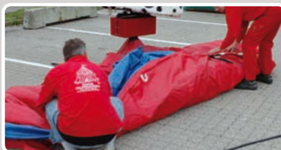
Fold den åbne side ind mod Rodeotyren.