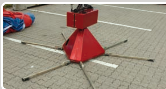
Motoren med alle seks stabiliseringsstænger.