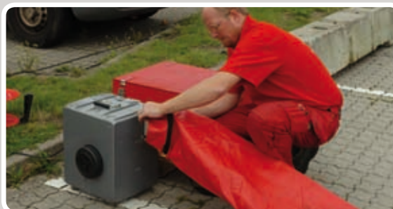
Bind studsens til blæseren.