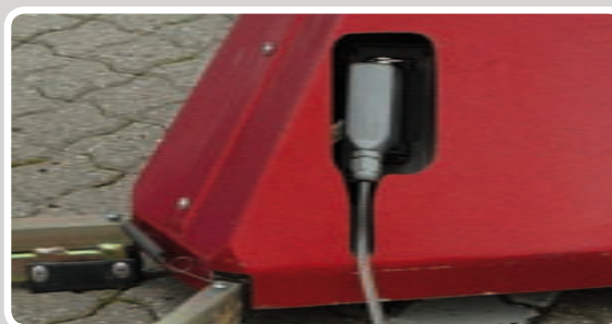
Sæt stikket fra kontrolpulten i motoren.