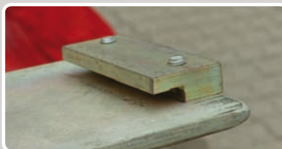
Løsn beslagene på motoren.