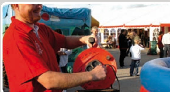
Sæt stikket i og opblæsningen vil begynde.