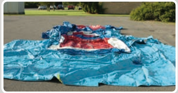
Læg siderne sammen så kanterne er frie.