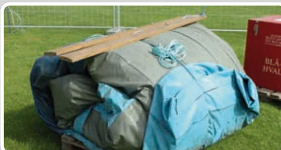
Bind den sammenrullede aktivitet sammen med reb.