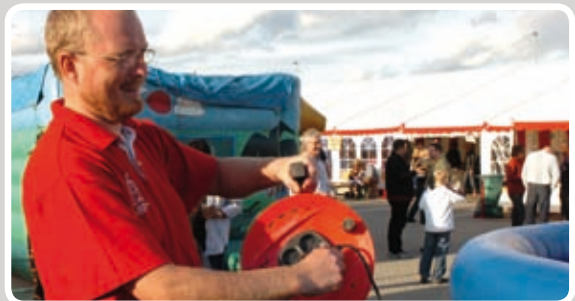
Stikket sættes i - og opblæsningen starter.