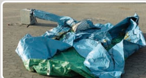
Læg aktiviteten helt ud.