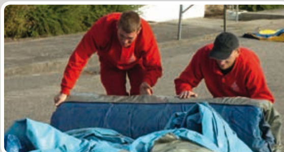
Rul aktiviteten sammen.