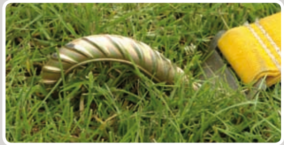
Max. 2,5 cm over jorden.