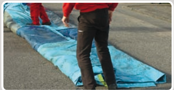
Træk den ene side helt over.