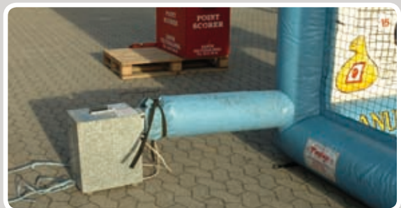
Afstand mellem blæser og aktivitet: min. 120 cm.