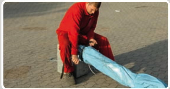
Monter studsens på blæseren.