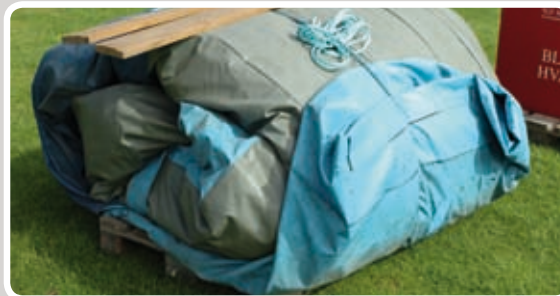
Rul Point Scorer ud.