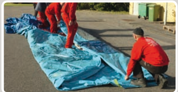
Træk den anden side ind mod midten.