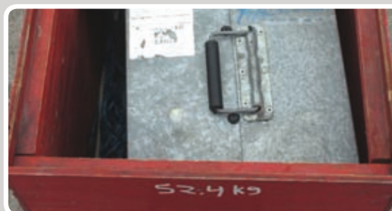
Pløkker, reb, kabelrulle og blæser lægges i kassen.