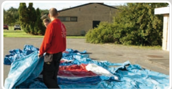
Læg den ene side ind mod midten.