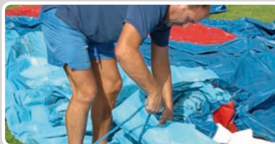
Bind studserne og lyn eventuelle lynlåse.