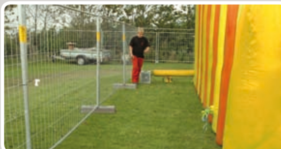
Friområde skal minimum være 180 cm.