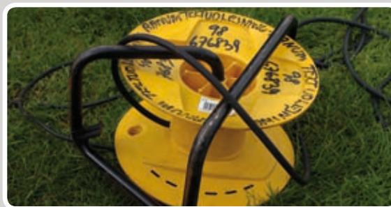
Rul kabelrullen helt ud.