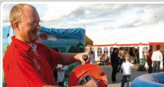
Sæt stikket i - og opblæsning starter.