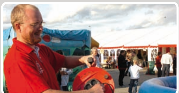
Sæt stikket i - og opblæsning starter.