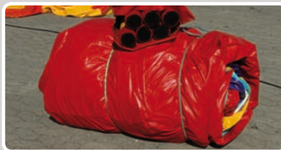
Rul hoppeborgen ud.