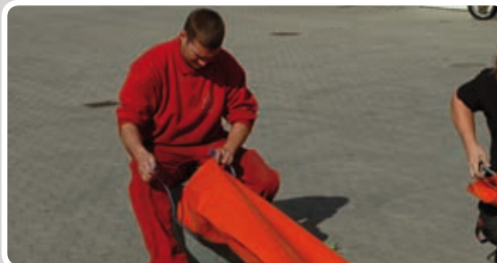
Montér studsene på blæseren.