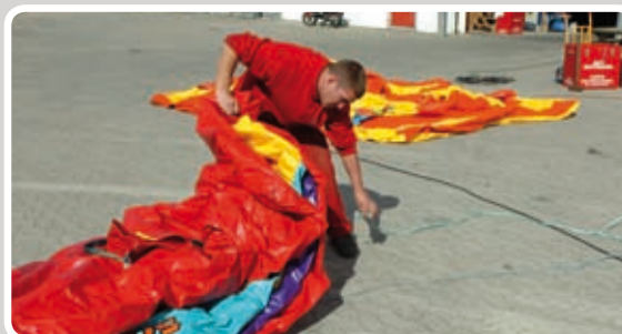
Læg reb under i enden af hoppeborgen.