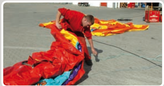
Læg reb under i enden af hoppeborgen.