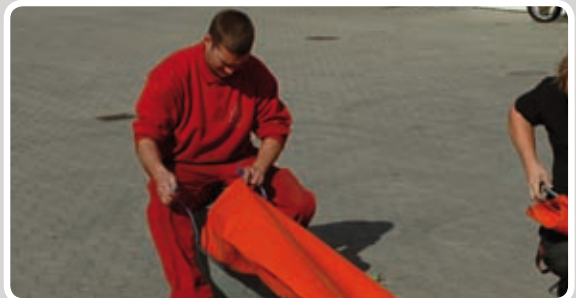
Montér studsene på blæseren.