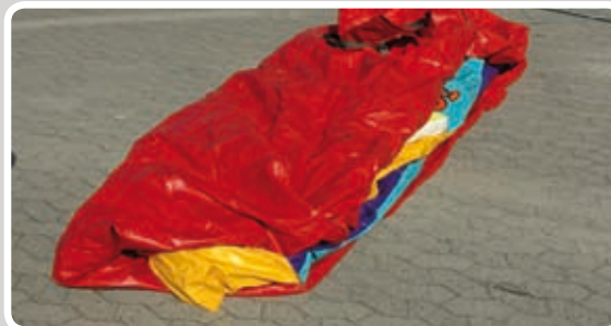
Læg mini hoppeborgen sammen på midten.