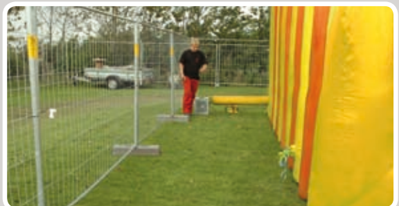
Friområde skal minimum være 180 cm.