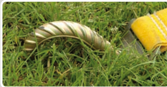
Max. 2,5 cm over jorden.