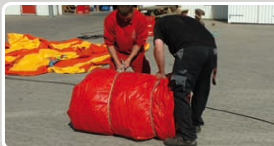
Bind rebene stramt.