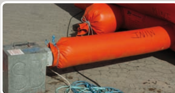
Afstand mellem blæser og aktivitet: min. 120 cm.