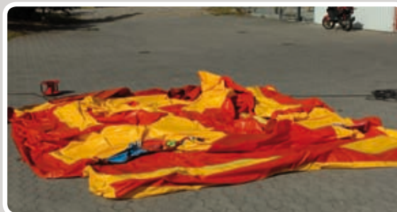
Læg aktiviteten helt ud.