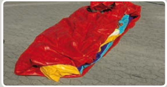
Læg mini hoppeborgen sammen på midten.