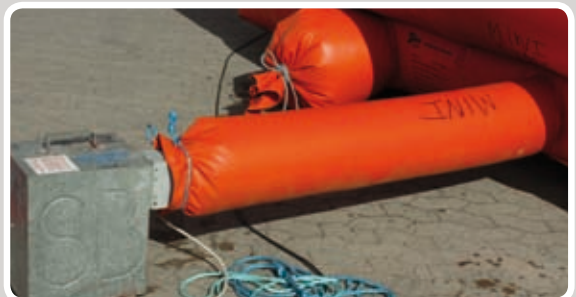
Afstand mellem blæser og aktivitet: min. 120 cm.