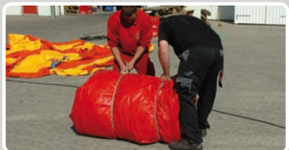
Bind rebene stramt.