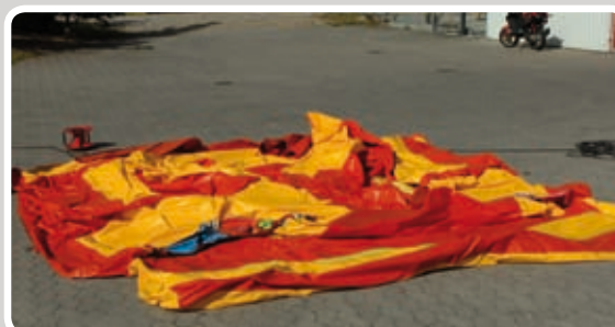
Læg aktiviteten helt ud.