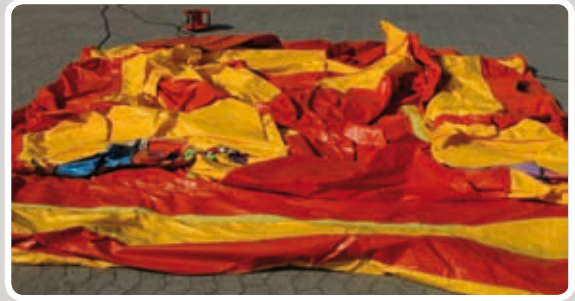
Læg siderne sammen så kanterne er frie.