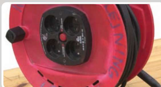
Kabelrulle ruller sammen.