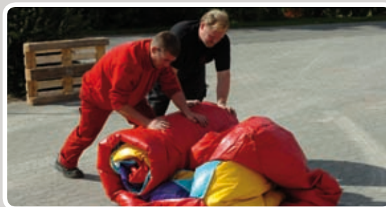
Rul hoppeborgen sammen.