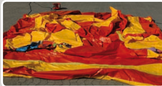
Læg siderne sammen så kanterne er frie.