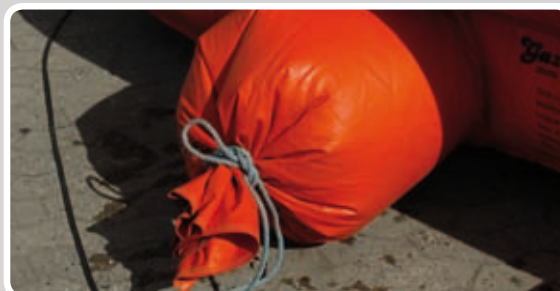
Luk studserne til med reb.