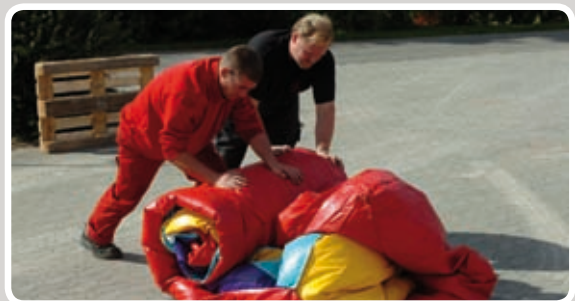
Rul hoppeborgen sammen.