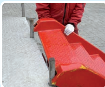
Trappen tages ud og påmonteres.