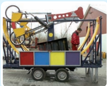
Sæt Cykeldromen hvor den skal være.