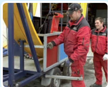
Låsene på sidesmækken fjernes.