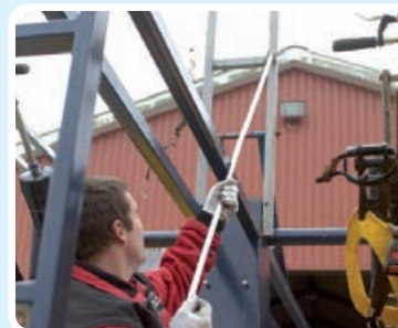
Med stang løftes topbeslaget op og låses fast med spænder.