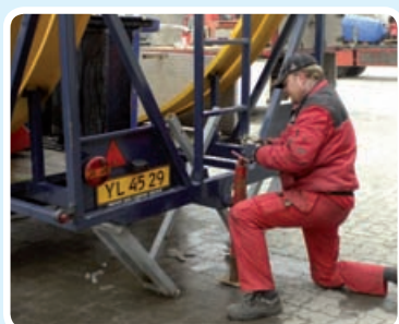
Spænd den bagerste donkraft..