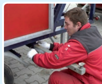
Holdere i begge sider trækkes ud.