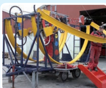
Halvcirklen trækkes op.