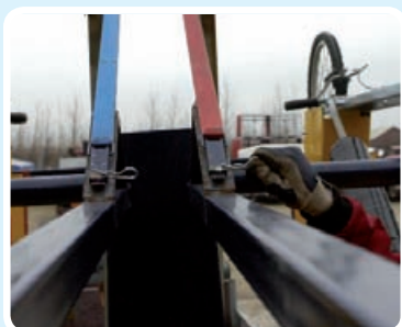
Lås af topbeslag.