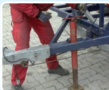
Spænd den røde donkraft.