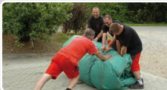
Bind den sammenrullede aktivitet sammen med reb.