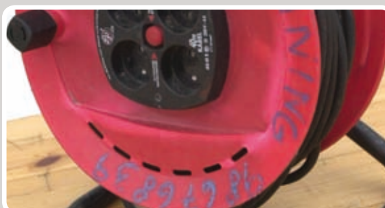
Kabelrulle rulles sammen.