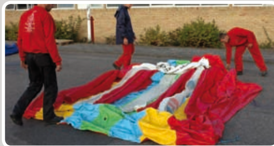
Læg siderne sammen så kanterne er frie.