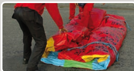
Træk den anden langside ind mod midten.