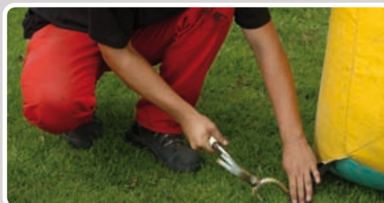
Slå pløkkerne i eller bind aktiviteten fast med reb.