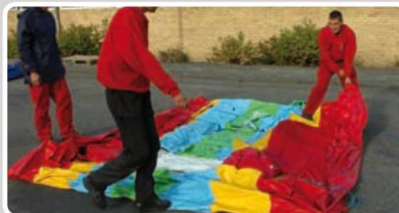
Læg aktiviteten helt ud på fladt underlag.