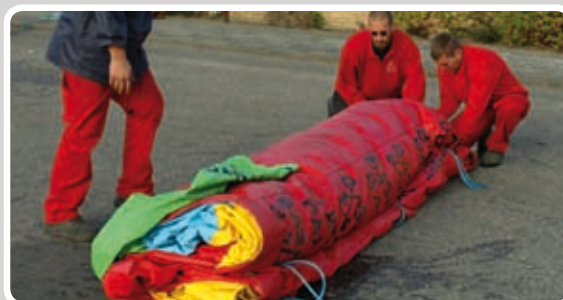
Fold aktiviteten på midten.