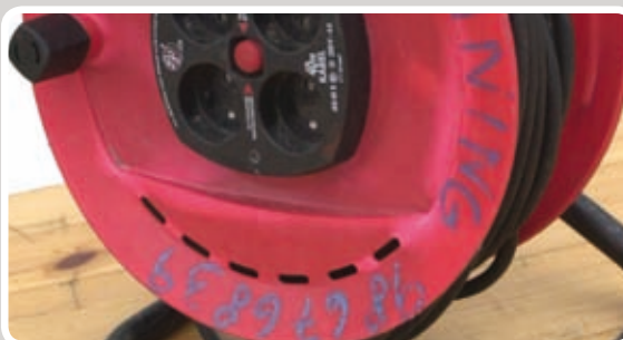
Kabelrulle rulles sammen.