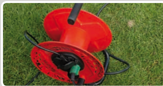
Rul kabelrullen helt ud.