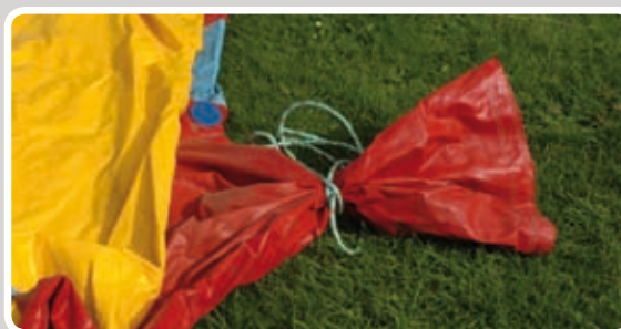
Bind studserne og lyn eventuelle lynlåse.