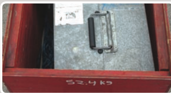
Pløkker, reb, kabelrulle og blæser lægges i kassen.