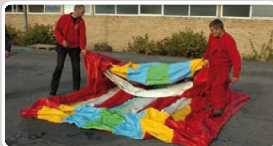
Læg kurv-delen ind mod midten.