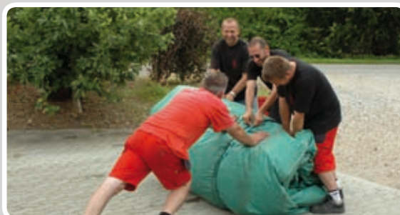
Bind den sammenrullede aktivitet sammen med reb.