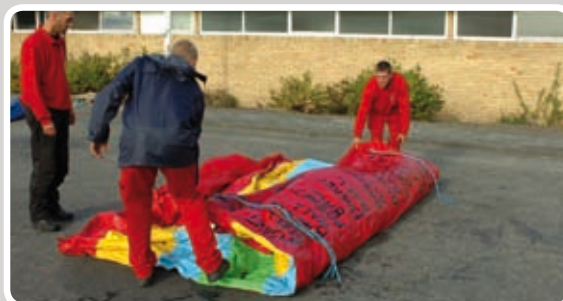
Træk en langside ind mod midten.