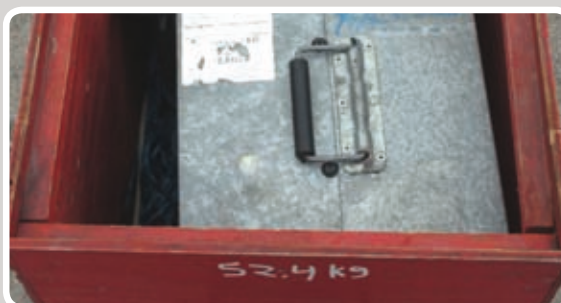
Pløkker, reb, kabelrulle og blæser lægges i kassen.