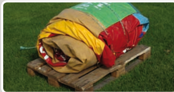
Rul Basket Ball ud.