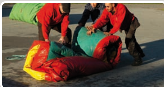
Læg reb under i enden af forlystelsen.