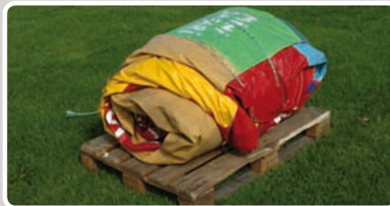
Rul Mini Safari ud.