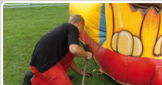
Slå pløkkerne helt i.