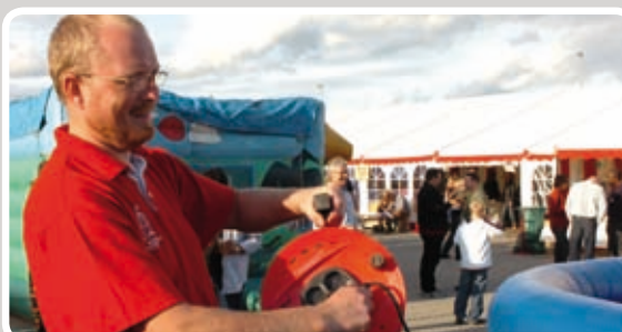
Stikket sættes i - og opblæsningen begynder.