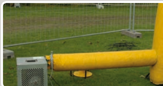
Afstand mellem blæser og aktivitet: min. 120 cm.