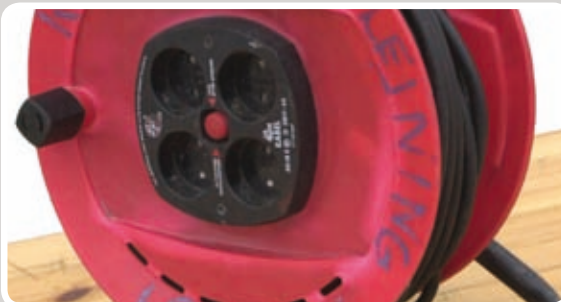
Kabelrulle rulles sammen.