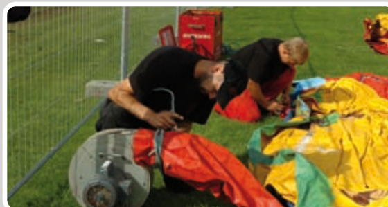
Monter studsen på blæseren.