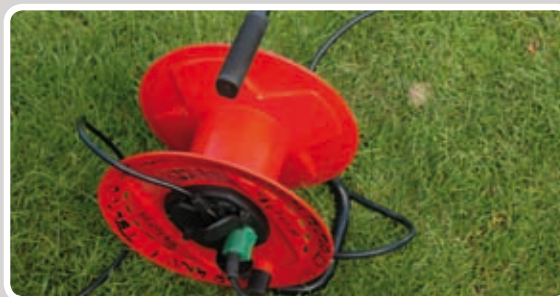
Rul kabelrullen helt ud.