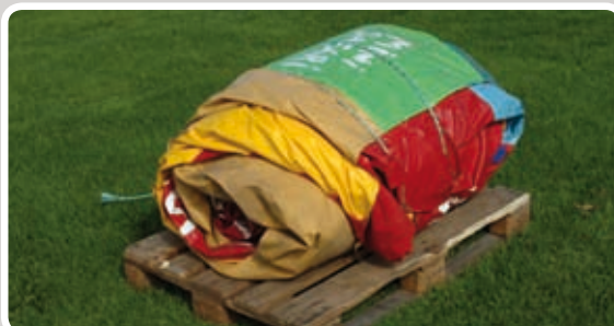
Bind forlystelsen sammen med reb.