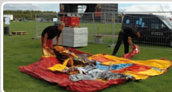
Læg aktiviteten ud på et fladt underlag.