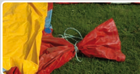
Bind studserne til med reb.