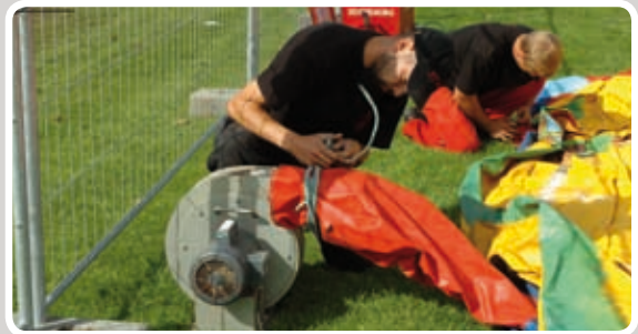
Monter studsene på blæseren.