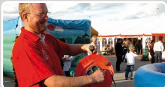
Stikket sættes i - og opblæsningen begynder.