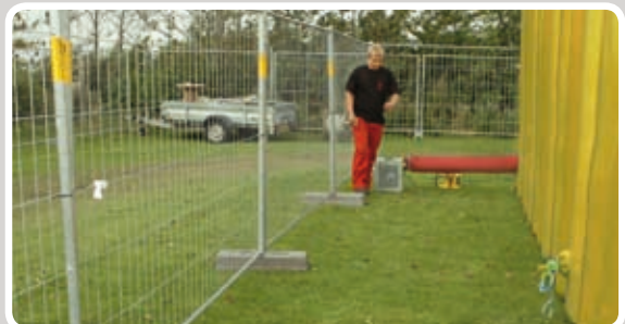
Friområde skal minimum være 180 cm.