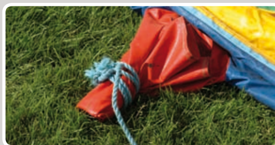
Luk studserne til med reb.