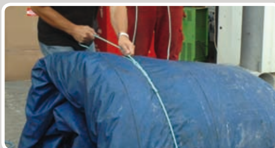
Reb strammes til.