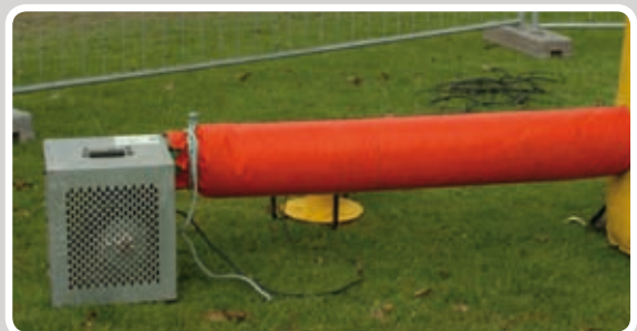
Afstand mellem blæser og aktivitet: min. 120 cm.