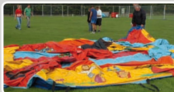
Læg aktiviteten helt ud.