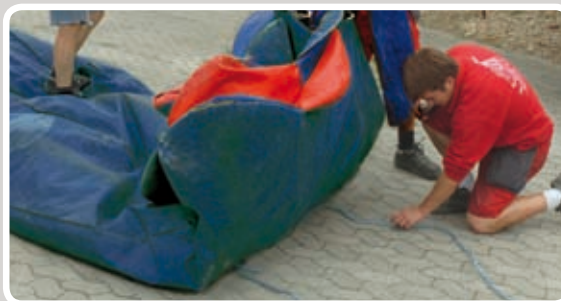
Læg reb under i enden og rul helt sammen.